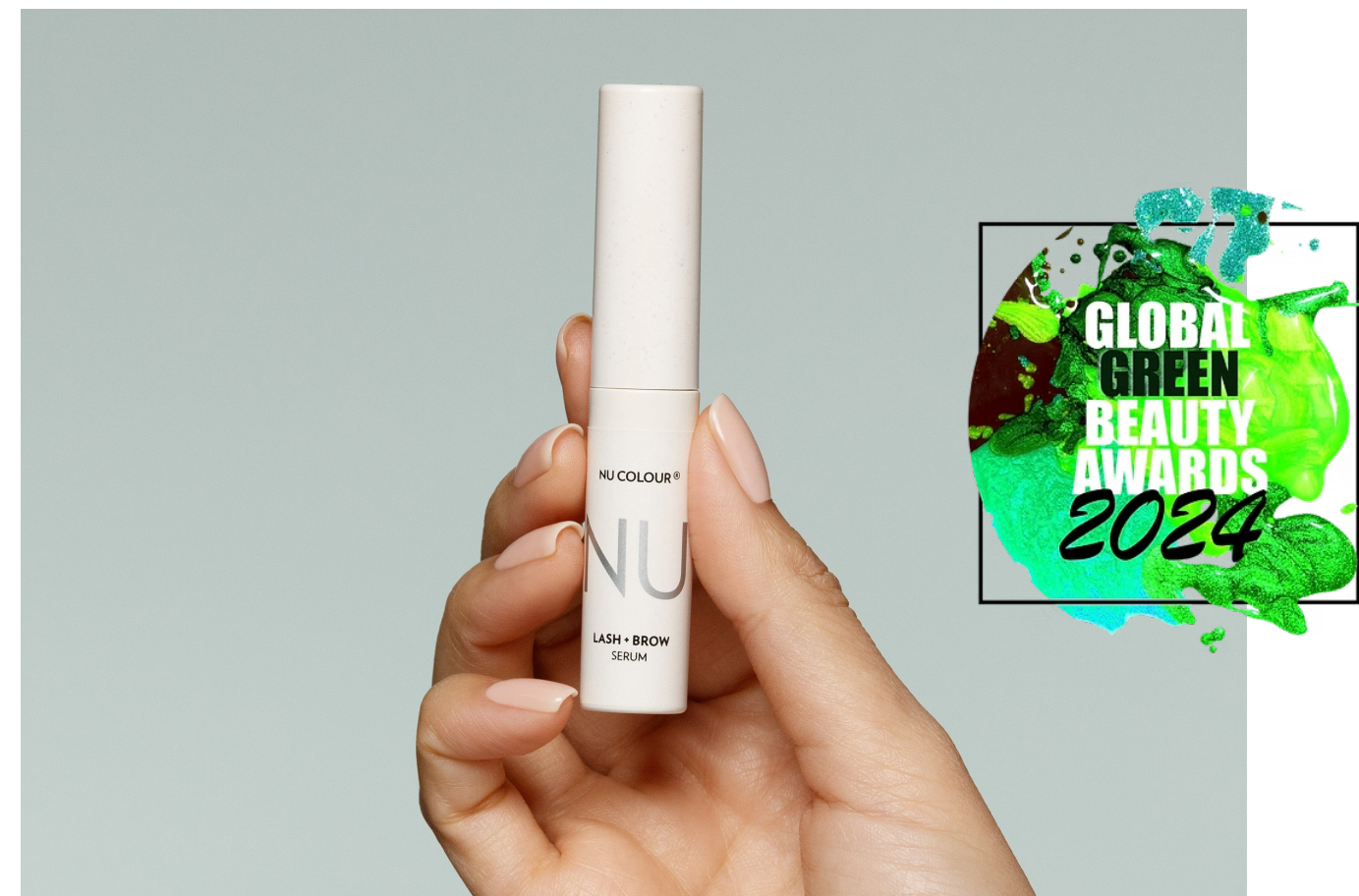
2024 グローバル グリーンビューティー アワード ベストナチュラル アイ/ブロウ プロダクト ニュー カラー ラッシュ+ブロウ セラム ベストナチュラル アイ/ブロウ プロダクト部門 銅賞

以下は、ニュースキンが2024年に受賞したプロダクト サステナビリティ アワードの一部です。