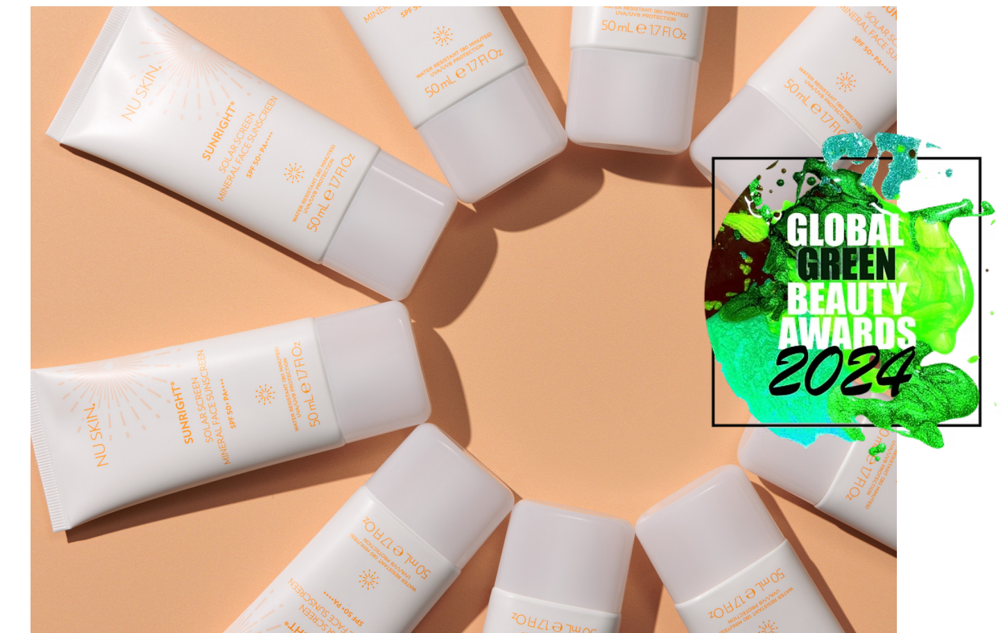
2024 グローバル グリーンビューティー アワード ベスト ナチュラル SPF50 プロダクト サンライト ミネラル サンスクリーン ベスト ナチュラル SPF50 プロダクト部門 銀賞