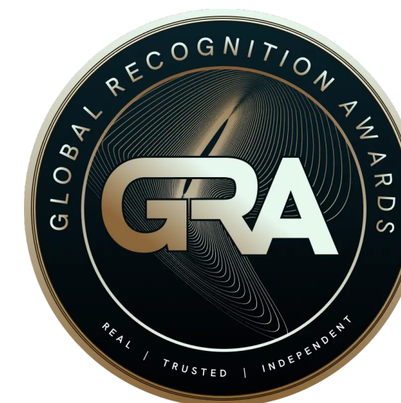
ニュースキン グローバル インパクト&コミュニティ エンゲージメント 2024 グローバル レコグニション アワード