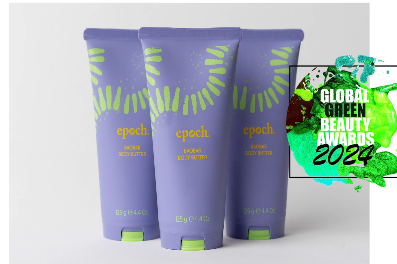
2024 グローバル グリーンビューティー アワード ベストナチュラル ボディ クリーム ベストシアバター プロダクト エポック バオバブ ボディ バター ベスト ナチュラル ボディ クリーム部門 金賞 ベスト シアバター プロダクト部門 銀賞